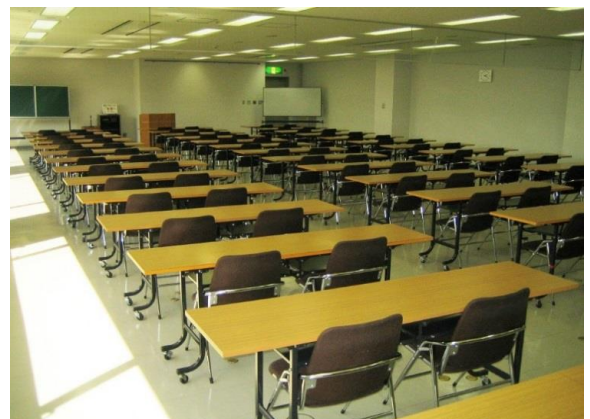
【大会議室】2人掛け ※常設は2人掛けです