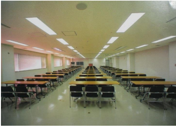
【大会議室】3人掛けの場合 ※会議室使用の注意